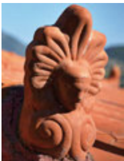
Eine Darstellung der Göttin Demeter, wie sie auf sehr vielen Hausdächern auf Lesbos zu finden ist.