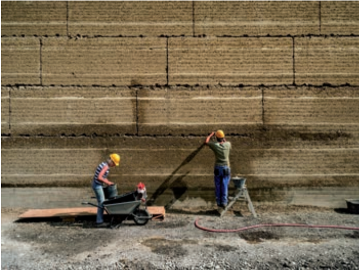
Ricola Kräuterzentrum, Architektur: Herzog & de Meuron, Lehmbau: Lehm Ton Erde Baukunst

Im Frühjahr zeugte eine Ausstellung in den Räumen des Vorarlberger Architektur Instituts in Dornbirn von der hohen Kunst des Lehmbaus weltweit. Dominique Gauzin-Müller, eine französische Architektin und Architekturkritikerin, die sich auf Nachhaltigkeit in Architektur und Städtebau spezialisiert hat, stellte fest, "dass weltweit über 2,5 Milliarden Menschen in Lehmhäusern wohnen". Klar, nicht viele haben den Standard, wie die in der Ausstellung gezeigten Bauten, die durch sorgfältige Architektur, Schönheit und Eleganz hervorstechen. Viele Häuser sind einfache Lehmhütten.