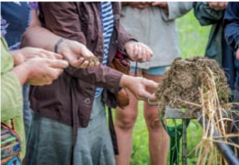
Exkursionsteilnehmer konnten Bodenproben mit allen Sinnen erkunden

"Boden-Schatzsuche" auf dem Bio-Bauernhof Wechselwirkungen zwischen Bodenleben, Pflanzenwachstum und Erdatmosphäre werden klar. Jeder kann sich für die Bodenfruchtbarkeit engagieren.