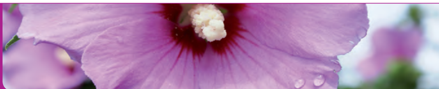
Berührungen der Seele

www.friedensmenschenkettebodensee.jimdo.com