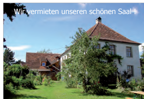
Wir vermieten unseren schönen Saal + Seminarhaus Lebenskunst-Bodensee 07553 / 596 wieland@web.de www.lebenskunst-bodensee.de

Yoga Vidya / Landhaus Ayurvedicus, Unterreute 5 88179 Oberreute , www.ayurvedicus.de www.yoga-oberreute.de