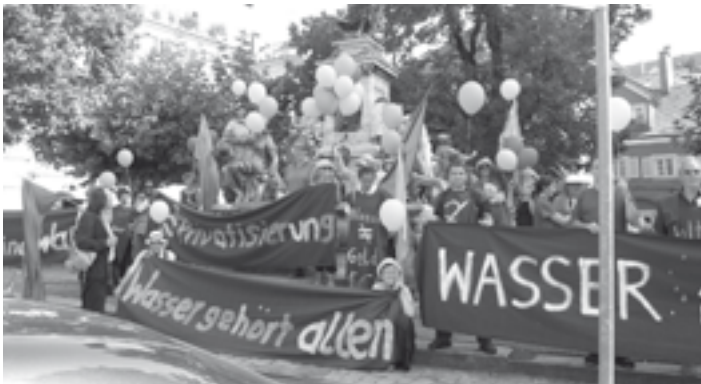
Wasser ist Zukunft - Wasser ist Leben - Wasser: Ein Grundrecht für alle!

Mit Aktionen am Bodensee setzt sich die Wasserkarawane für das Wasser ein. Auftakt der Veranstaltungsaktivitäten war 2004 das Bodensee-Wasser-Festival in Überlingen. 2005 zog die Karawane von Kamelen begleitet von Überlingen nach Bregenz. Mit dieser einwöchigen Wanderung am See entlang hat die vielköpfige Karawane über die Machenschaften privater Investoren und die Gefahren der Privatisierung unseres wichtigsten Lebensmittels WASSER die Bürger durch unterschiedlichste Aktionen informiert. Wichtig waren uns vor allen Dingen künstlerische Darbietungen, um sich dem Wasser emotional und über ein eigenes Erleben zu nähern, nicht nur intellektuell.