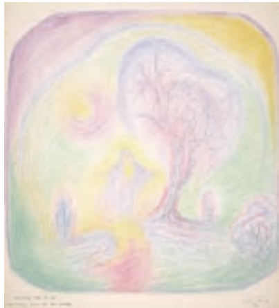
Madonna auf den Fluren 1958 NE 01